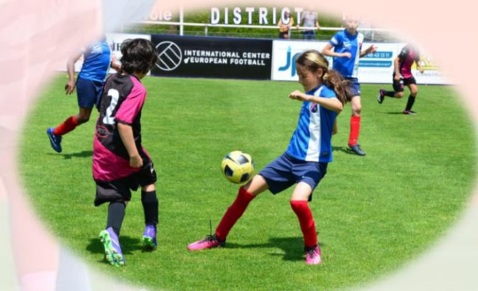
ÉTÉ DU FOOTBALL FEMININ