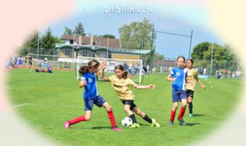
ÉTÉ DU FOOTBALL FEMININ