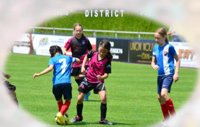
ÉTÉ DU FOOTBALL FEMININ