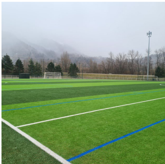
Synthétique de Passy