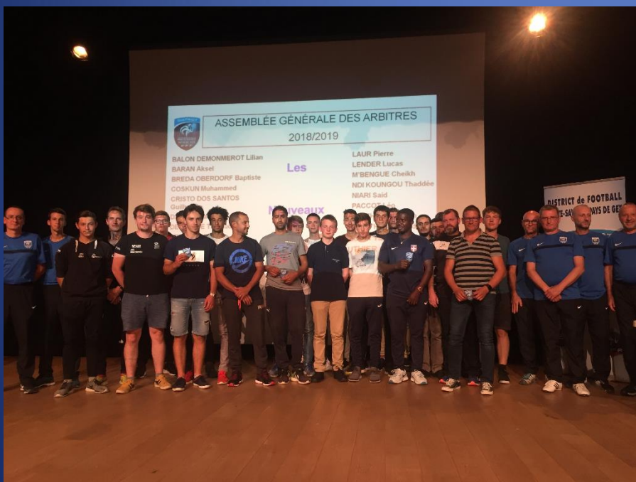
Les nouveaux arbitres

Remerciements à la Mairie et au collège Paul Langevin de Ville La Grand