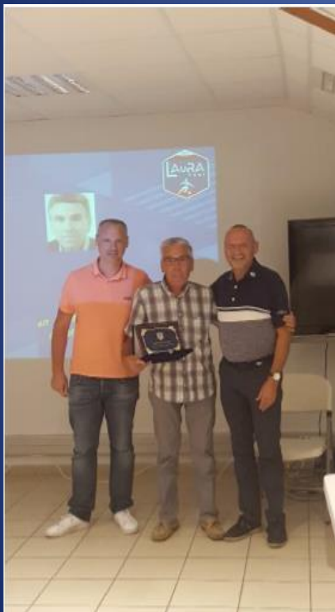
Trophée d'honneur Louis GIMENEZ

L'observateur est un PARTENAIRE capital de notre structure arbitrale. Lui aussi se forme chaque année et essaie de mettre en application les objectifs donnés par les commissions d'arbitrage.