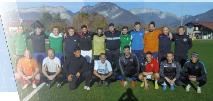
Formation CFF3 - Novembre 2017 - Sevrier

Tous les membres du Comité de Direction sont habilités à remettre les matchs de championnat et/ou Coupes du District, en fonction de leur secteur géographique.