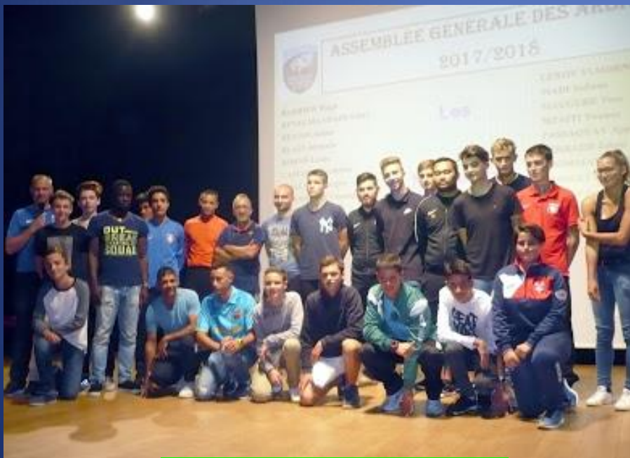
Les nouveaux arbitres