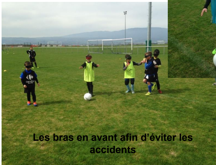
Les bras en avant afin d'éviter les accidents