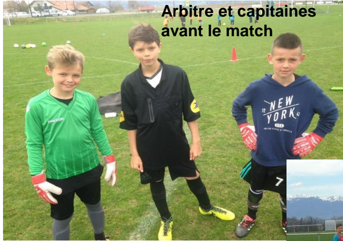
Arbitre et capitaines avant le match