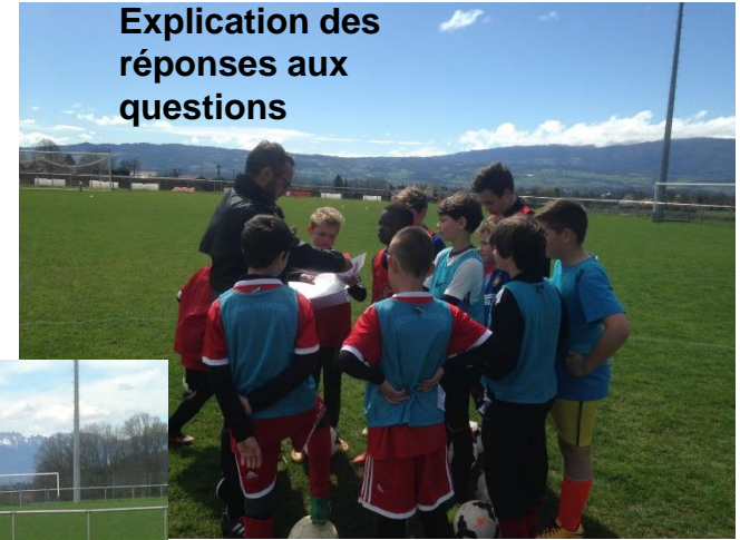
Explication des réponses aux questions