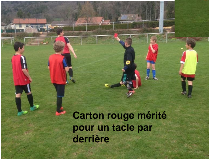
Carton rouge mérité pour un tacle par derrière