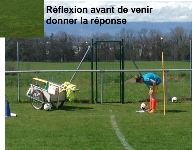
Réflexion avant de venir donner la réponse